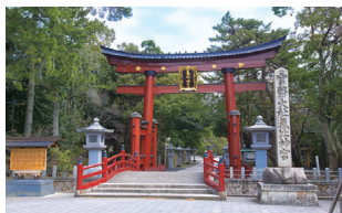
国の重要文化財である氣比神宮の大鳥居

した破魔矢、くまで、御守りなども授与されます。福井県敦賀市に鎮座する氣比神宮は北陸道総鎮守であり、地元では親しみをこめて「けいさん」と呼ばれています。木造の大鳥居は、春日大社(奈良)、嚴島神社(広島)と並ぶ日本三大木造鳥居であり、正面の扁額には有栖川宮威仁親王の御染筆です。祀られた神々の御神徳が宿る神水として信仰される「長命水」は、パワースポットとして人気。三が日は多くの参拝者で賑わいます。北陸三県の歴史ある神社仏閣で新しい年の始まりを迎えませんか。