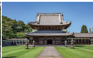
瑞龍寺の仏殿(国宝)