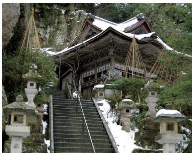
那谷寺の大悲閣(本殿)

今注目の北陸3県では、「Japanese Beauty Hokuriku キャンペーン」を2024年3月まで実施中です。「美観」「美食」「美技」「美湯」「美心」の5つの美のコンセプトのもと、情緒ある奥深い北陸の旅をご提案します。